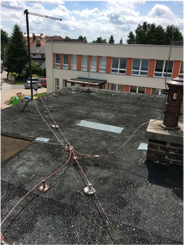
televizní anténa v jihovýchodním rohu objektu