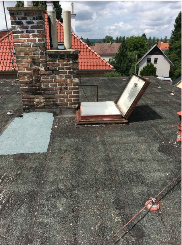
komínové těleso s výlezem na střechu